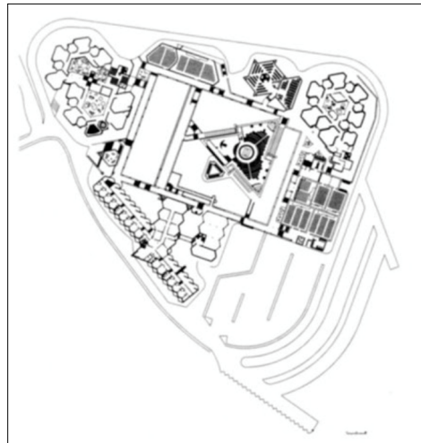
Miguel de Oriol, 1964.