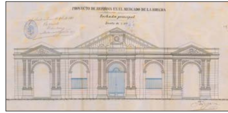
Egileak eta data: Antonio Cortazar; 1870 / Jose Goicoa; 1898.