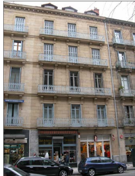
Egilea eta data: Sebastian Camio; 1900.