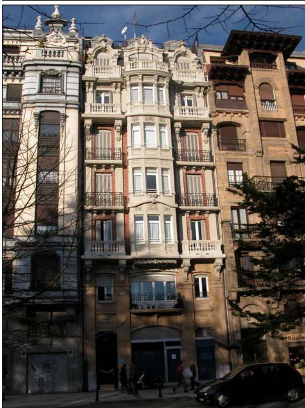
Egilea eta data: Roberto Garcia Ochoa; 1922