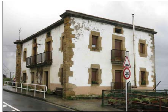
Egile eta data ezezagunak