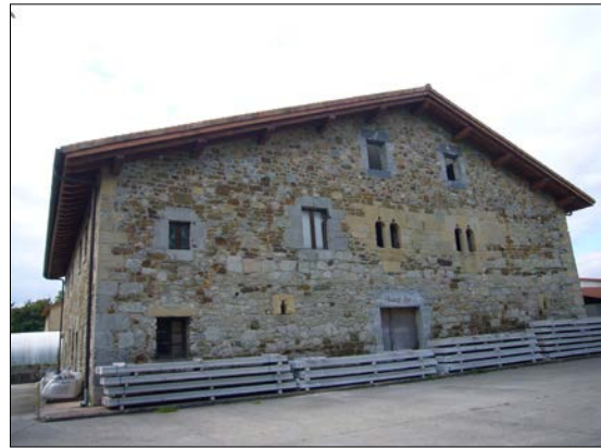
Egile eta data ezezagunak.