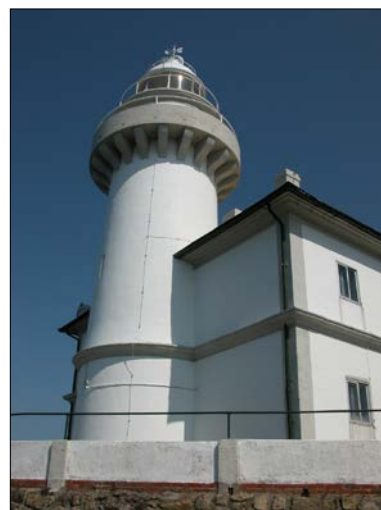
Egilea eta data: Manuel Peironcely-ri egotzia; 1855