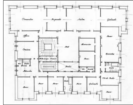
Egilea eta data: Eduardo Lagarde; 1935.