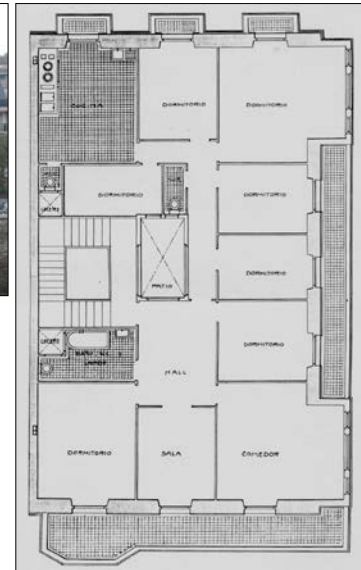
Egilea eta data: Ramon Cortazar, 1917.