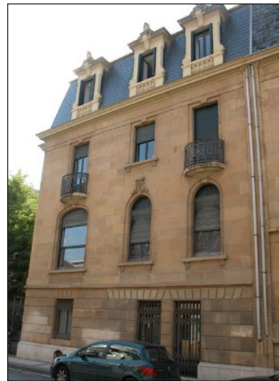
Egilea eta data: Ramon Cortazar; 1926