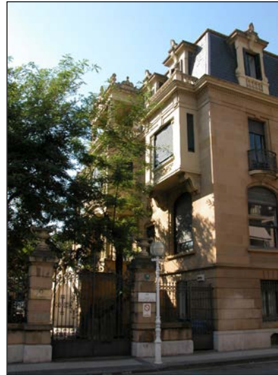
Egilea eta data: Ramon Cortazar, 1926.