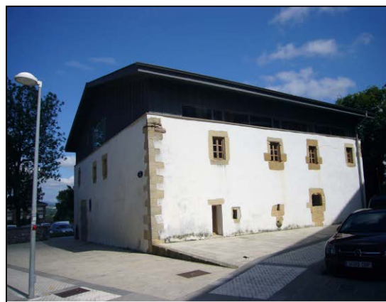
Egile eta data ezezagunak