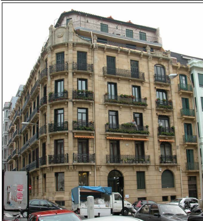
Egile ezezaguna, 1911 Ez dago jatorrizko proiektuaren planorik Udal Artxiboan