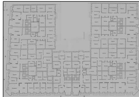
Egilea eta data: Francisco Urcola; 1914