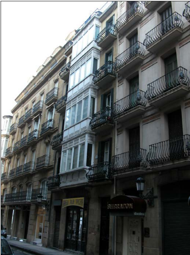
Egile eta data ezezagunak (ez dago espedienterik Udal Artxiboan)