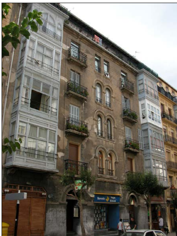
Egilea eta data: Ramon Cortazar; 1922 (Ez dago jatorrizko proiektuaren planorik Udal Artxiboan)