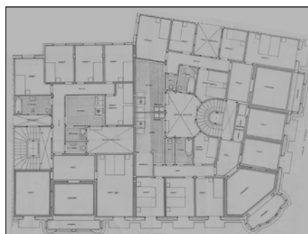
Egilea eta data: Domingo Aguirrebengoa; 1926