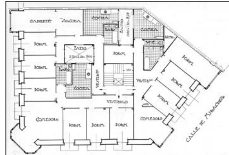
Egilea eta data: Francisco Urcola; 1928