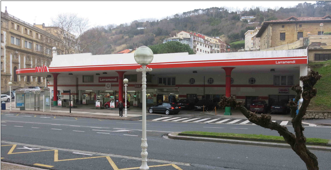
Egilea eta data: Ramon Cortazar, 1933.