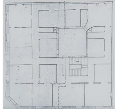
Egilea eta data: Eleuterio de Escoriaza; 1865