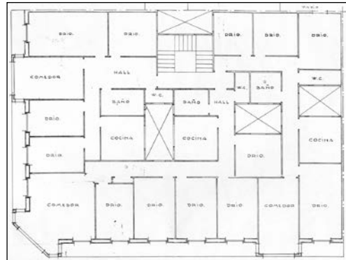
Egilea eta data: Pablo Zabalo; 1931