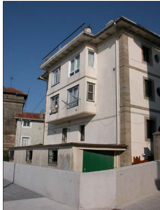
Egile eta data ezezagunak