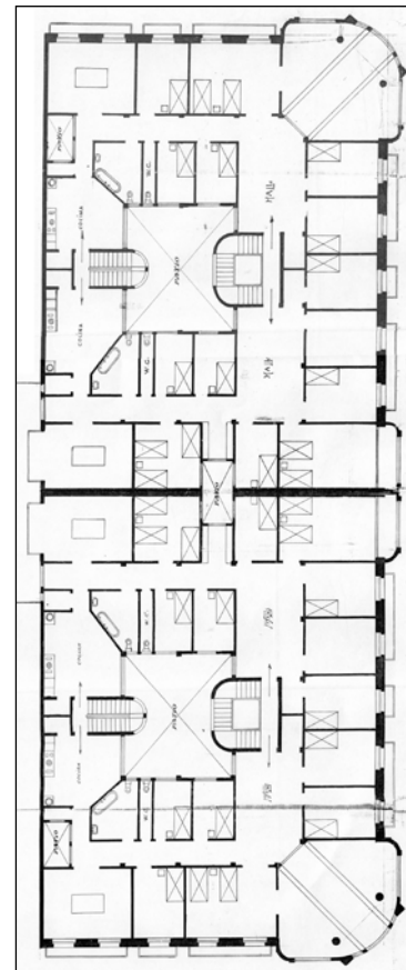
Egilea eta data: Lucas Alday; 1920