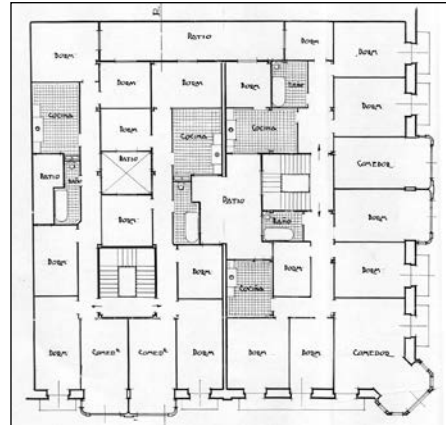
Egilea eta data: Francisco Urcola; 1924