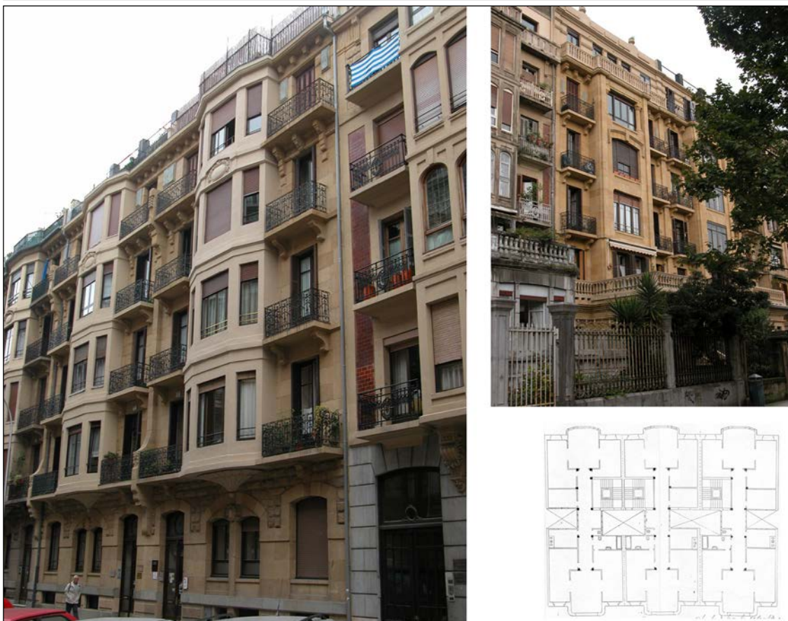
Egilea eta data: Lucas Alday; 1919