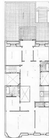
Egilea eta data: Ramon Cortazar; 1919