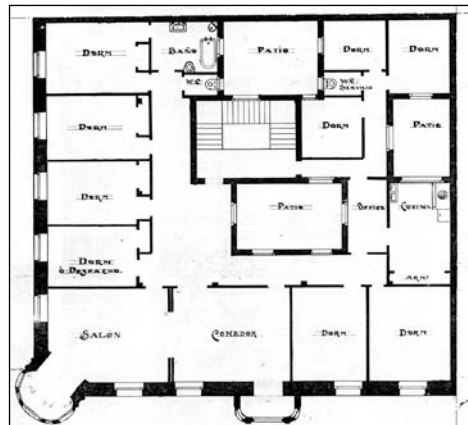
Egilea eta data: Francisco Urcola; 1920