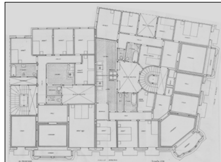
Egilea eta data: Domingo Aguirrebengoa; 1926