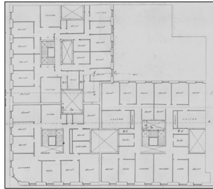
Egilea eta data: Gurruchaga; 1911