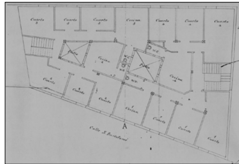
Egilea eta data: Ramon Cortazar; 1905