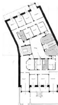
Egilea eta data: Luis Elizalde; 1919