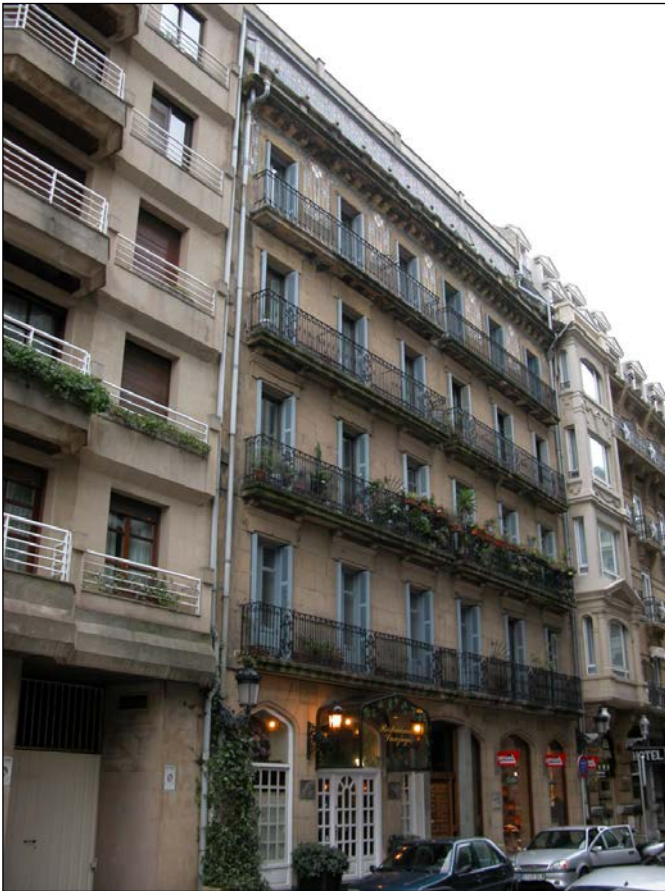
Egile eta data ezezagunak (1901/1904 inguru) (Ez dago jatorrizko proiekturik Udal Artxiboan)