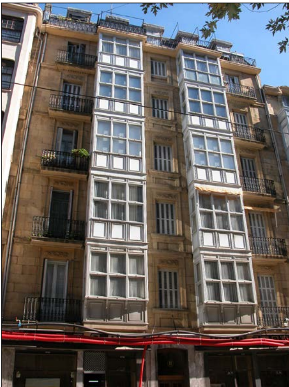
Egilea eta data: Jose Maria Mujica; 1891 (Ez dago jatorrizko proiekturik Udal Artxiboan)