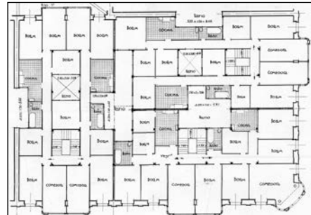
Egilea eta data: Francisco Urcola; 1925