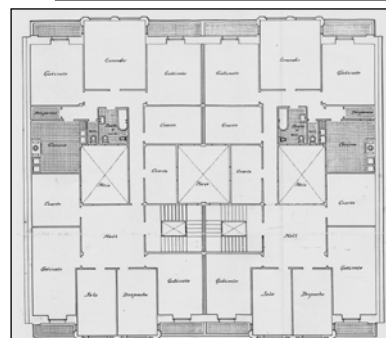
Egilea eta data: Ramon Cortazar; 1917