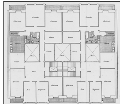
Egilea eta data: Ramon Cortazar; 1917