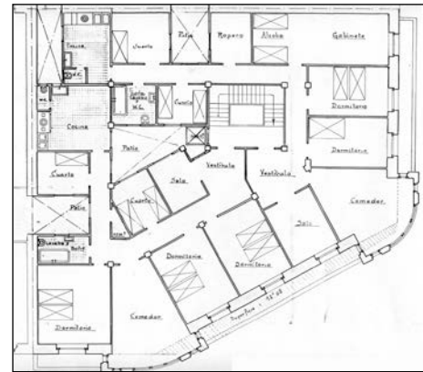
Egilea eta data: Ramon Cortazar; 1922