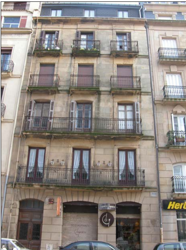
Egilea eta data: Benito Olasagasti, 1883? Ez dago jatorrizko proiekturik Udal Artxiboaren espedienteetan