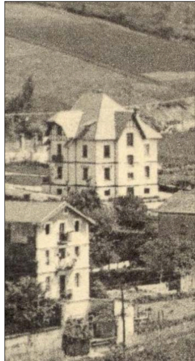
Egile ezezaguna, 1910 inguruan