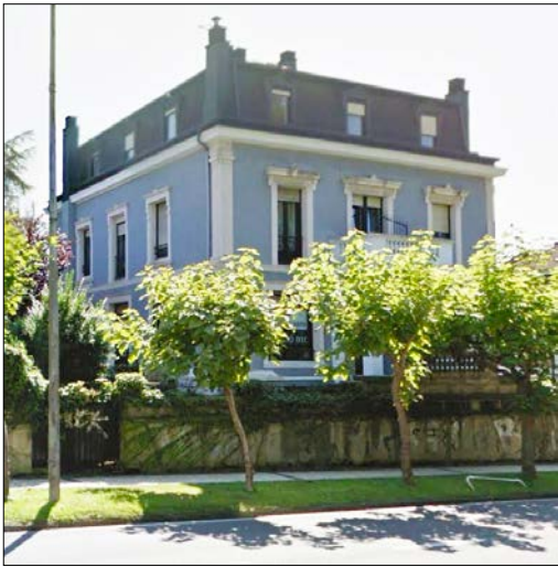
Egile ezezaguna, 1900 inguruan