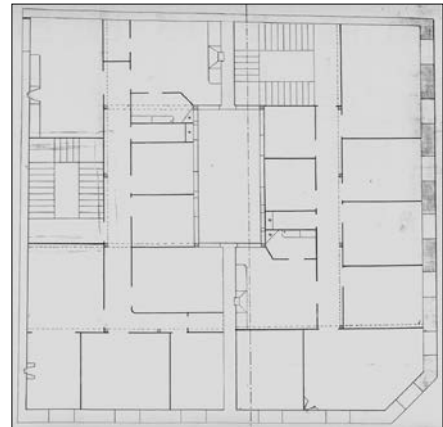
Egilea eta data: Benito Olasagasti; 1881.