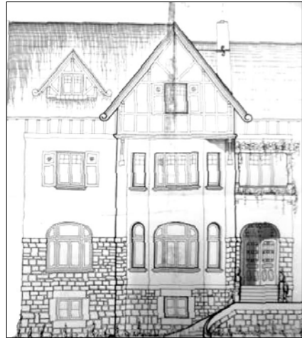
Domingo Agirrebengoa, 1934.