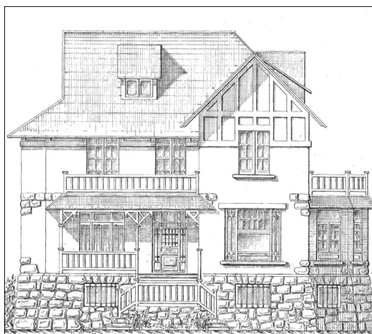
Ramon Kortazar, 1912