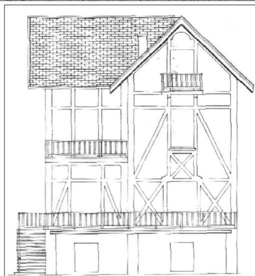
Domingo Ezeizta, 1897.