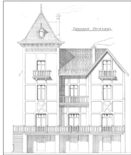
Domingo Ezeiza, 1897