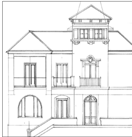
Migel Irastortza, 1917