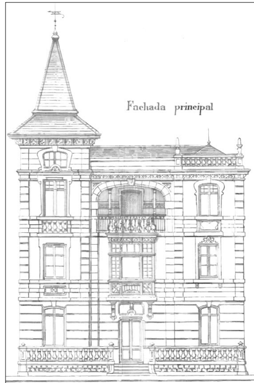
Migel Irastortza, 1904