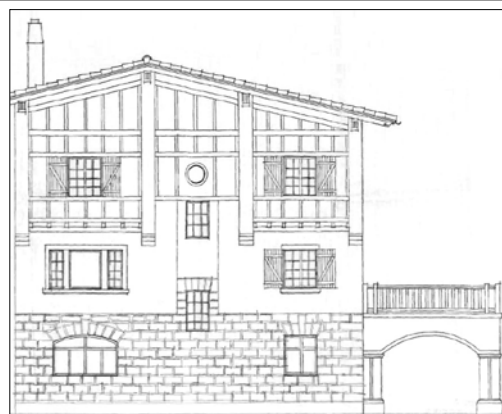
Frantzisko Urkola, 1916.