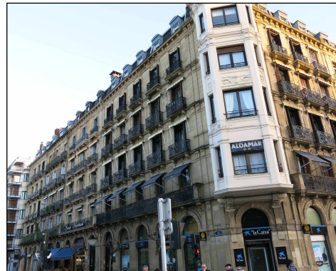
Egilea eta data: Jose M a Mujica; 1886