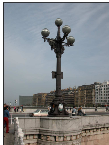
Egilea eta data: Antonio Cortazar; 1869